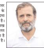
अमेरिका में विवादित बयान देने का लगा आरोप

नई दिल्ली, 21 सितंबर (न्यूज चैनल)। उत्तर प्रदेश के वाराणसी में कांग्रेस नेता राहुल गांधी के खिलाफ मुकदमा दर्ज किया गया है। यह मुकदमा शुक्रवार को सिगरा थाने में दर्ज किया गया है। आरोप है कि राहुल गांधी ने अमेरिका में सिख समुदाय, दलित और पिछड़ों के आरक्षण पर गलत बयानबाजी कर उनकी भावनाओं को आहत किया है और देश को एकता-अखंडता की प्रभावित किया है।