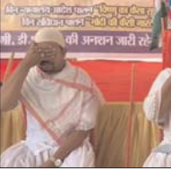
महत्मा गांधी का स्वयं धारण कर जताया विरोध, सरकार पर हाईकोर्ट के अपमान का लगाया आरोप

रावपुर, 3 अक्टूबर (हाईवे चैनल)। छत्तीसगढ़ के सभी डी.एड. भर्ती के पीछे अनिश्चितकालीन धरने पर बैठ चुके हैं। अभ्यर्थियों का आरोप है कि सरकार हाई कोर्ट और सुप्रीम कोर्ट के फैसले के महीनों बीत जाने के बाद भी नियुक्ति का अनादेश कर कोर्ट के फैसले का अमान्य कर रही है। 13 महीनों से अभ्यर्थी सरकार से नियुक्ति का इंतजार कर रहे हैं। आज गांधी जयंती के अवसर पर अभ्यर्थियों ने महत्मा गांधी का स्वयं धारण कर एक बार फिर अपनी माँग सरकार के समक्ष रखी है। अभ्यर्थियों का कहना है कि परधाना प्रदर्शन के ज़रिए पहले भी सरकार से नियुक्ति की माँग का जूचो है। लेकिन कोई तैतीजा नहीं निकलने पर अब अनिश्चितकालीन हड़ताल पर सभी बैठने को मजबूर है। दरअसल, पिछली सरकार ने 4 मई 2023 को 12,489 पदों पर शिक्षक नती निकाली