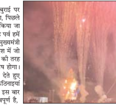
खुशहाली लेकर आए। इसी तरह राठपुर के ऐतिहासिक रावण भाटा मैदान में रावण वध किया गया। दूधधारी मठ से भगवान श्रीराम - बालाजी भगवान रावण वध के शाम में पूरे अपने जलसे के साथ निकले और रावण भाटा में आतिशबाजी और अखाड़ी के साथ रावण दहन हुआ। सप्रेम स्कूल मैदान बुढ़ापारा में जबदस्त आतिशबाजी हुई और 50 फीट से ऊपर रावण, मेघनाथ, कुंभकर्ण का पुतला दहन किया गया। इसी प्रकार राजेन्द्र नगर, चौबे कॉलोनी, भाटागांव, बौरागांव, शंकर नगर तथा गुड़ियारी के सोपर्सवडी मैदान तथा पड़वा में 50 से ऊपर रावण के पुतले का दहन किया गया।

सीएम विष्णु देव साय ने कार्यक्रम में अपने संबोधन के दौरान प्रदेशवासियों को विजयादशमी की शुभकामनाएं देते हुए कहा कि यह पर्व असत्य पर सत्य और बुराई पर अच्छाई की जीत का प्रतीक है। उन्होंने कहा, पिछले 53 वर्षों से यहाँ रावण वध का आयोजन किया जा रहा है। भगवान राम हमारे भांजा हैं और यह पर्व हमें सत्य के मार्ग पर चलने की प्रेरणा देता है। मुख्यमंत्री ने कहा, आज हम सभी संकल्प लें कि प्रदेश में जो भी बुराई है, उसे राम, लक्ष्मण और हनुमान की तरह दूर करेंगे। तभी विजयादशमी का पर्व विशेष होगा। उन्होंने सत्य के मार्ग पर चलने की प्रेरणा देते हुए कहा कि चाहे कितनी भी परेशानियाँ और कठिनाइयाँ आएँ, अंत में विजय सत्य की ही होती है। इस बार का विजयादशमी पर्व विशेष रूप से महत्वपूर्ण है, क्योंकि 500 वर्षों के बाद भगवान रामलला अयोध्या के भव्य राम मंदिर में विजयमान हुए हैं। मुख्यमंत्री ने इस पावन पर्व को कामना करते हुए कहा कि यह सभी की जीवन से नकारात्मकता और कठिनाइयों का अंत कर सुख, समृद्धि और