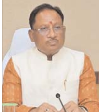
विदेशी फंडिंग के दुरुपयोग पर उठाए गंभीर सवाल

रायपुर, 21 फरवरी (हाईवे चैनल)। मुख्यमंत्री विष्णुदेव साय ने छत्तीसगढ़ में कार्यालय कृषि, सारकारी संगठनों को दी गई फंडिंग के दुरुपयोग को लेकर गंभीर चिंता व्यक्त की है। उन्होंने कहा कि इस विदेशी सहायता का उपयोग धर्मांतरण जैसी अवैध गतिविधियों में किया जा रहा है। मुख्यमंत्री श्री साय ने कहा कि साम्राज्य देश एक धर्मांतरण देश है, जहां हर व्यक्ति को अपनी इच्छा के अनुसार धर्म मानने की स्वतंत्रता है। लेकिन जब अशिक्षा, गरीबी, चंगाई या लोक-परलोक के नाम पर लोगों को बहकाकर या प्रलोभन देकर जबरन धर्म परिवर्तन कराया जाता है, तो यह न केवल अनैतिक है, बल्कि संविधान की मूल भावना के भी विरुद्ध है। मुख्यमंत्री श्री साय ने यह भी कहा कि कई अंतरराष्ट्रीय एजेंसियां स्वास्थ्य और शिक्षा के नाम पर विदेशी धन प्राप्त करती हैं, लेकिन इसकी आड़ में स्थानीय लोगों को भ्रमित कर, लालच देकर, चंगाई के माध्यम से धर्मांतरण कराती हैं। उन्होंने स्पष्ट रूप से कहा कि इस मामले की गहराई से जांच होनी चाहिए ताकि यह सुनिश्चित किया जा सके कि इन एजेंसियों को किस उद्देश्य के लिए फंडिंग दी जा रही है, उसका सही उपयोग हो रहा है या नहीं।