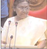
राष्ट्रपति ने मिनीमाता को किया याद कहां- मेरा छत्तीसगढ़ से गहरा संबंध उषा विधानसभा में प्रबोधन कार्यक्रम