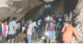
और इसी दिन यहां भावान शिव के दुर्घन दर्शन होता है। गुफा खुलने के बाद सबसे पहले उज्ज्वलता वाघविराव दारा गुफा-अर्द्धा की जायते हैं। यही श्रद्धालुओं के लिए दर्शन शुरू होते हैं। फते खोलों और खोलीयों के बीच स्थित इस गुफा तक पहुंचना भी किसी चुनौती से कम नहीं है। श्रद्धालुओं को कठिन राहों से होकर पहुंचना पड़ता है और कई बार नदी पर अस्थव्युत्थान से बचने के लिए आस्था के साथ-साथ साहस और रोमांच से भी गुजरना पड़ता है। गुफा में प्रार्थना, प्राकृतिक खिलखिल, पवित्र कुंड और 'शैव गुफा' नाम की जलधारा इसे और भी खास बनाते हैं। यही जलधारा आसपास के क्षेत्रों के लिए महत्वपूर्ण जल स्रोत भी मानी जाती है। इसी क्षेत्र से यह गुफा प्रकृति और आस्था के अनेक सौम्य के रूप में जानी जाती है और हर साल अर्द्धा के अलावा प्रशासन, महाराष्ट्र समेत अन्य राज्यों से भी बड़ी संख्या में लोग यहां पहुंचते हैं।

खैरागढ़, 24 अप्रैल (हाईवे चैनल)। खैरागढ़-जुहवाड़ा-गड्डा क्षेत्र के लक्ष्मीटोला जमींदारों में स्थित मण्डीप खोल गुफा एक बार फिर श्रद्धालुओं की आस्था का केंद्र बनने का राह है। साल में सिर्फ एक दिन खुलने वाली यह गुफा 27 अप्रैल को श्रद्धालुओं के लिए खोली जाएगी। इसे लेकर फिल्मा प्रशासन पूरी तरह अर्द्ध मॉडर हो गई है और सुरक्षा, स्वास्थ्य, यातायात और भ्रमण सुविधाओं की पूर्ण तैयारी अंतिम चरण में है।