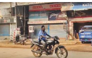
में प्रशासन ने 6 घणों पर कार्रवाई को लेकर स्थानीय बुलडोजर कार्रवाई की थी, इस लोगों में नाराजगी देखने को

पखाऊर, 24 अप्रैल (हाईवे चैनल)। कांकेर क्षेत्र के पखाऊर में पिछले दिनों हुई प्रशासनिक कार्रवाई के विरोध को लेकर नाराजगी बढ़ते नजर आने लगी है। शुक्रवार को आम समाज ने बंद का आह्वान किया है। जिसका अंतर कापामी, पखाऊर और वाई क्षेत्र में सुबह से देखने को मिल रहा है। एसडीएम कार्यालय घेराव के साथ बंद प्रदर्शन की तैयारी है। जानकारी के मुताबिक, शह हॉल में नया पारा